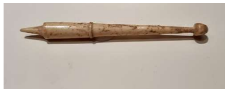
Stilus (punxó per escriure sobre cera) Segle I a.n.e. Les Borges Blanques Direcció General del Patrimoni Cultural de la Generalitat de Catalunya

L'àmbit 'Les petites Romes de Ponent' parla del naixement d'Ilerda, Iesso i Aeso, en l'inici del procés de romanització, amb el qual, es van desmantellar progressivament els enclavaments militars i es van començar a fundar ciutats. Es volia integrar els habitants del territori a la nova cultura romana, a través de la fundació de ciutats emmurallades, creades a imatge i semblança de Roma. En un principi, conviuen les dos cultures i, a poc a poc, es va produir un procés de romanització que va comportar l'abandonament dels costums i les creences ibèriques, i l'adopció del nou model romà.