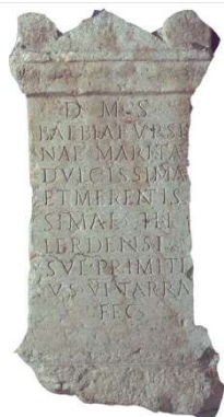
Altar funerari Segles II-III Museu Nacional Arqueològic de Tarragona

El penúltim àmbit de l'exposició, 'Que la terra et sigui lleu' , parla de la mort. Quan una persona es moria, es rentava amb olis i ungüents per purificar-la i la família la vetllava fins que es feia el funeral, que incloïa un banquet. A les tombes, depenent del nivell social de la família s'hi dipositaven ofrenes. Els cementiris eren fora de les ciutats, però no en recintes tancats, sinó al llarg de les vies. La necròpolis de Lleida és l'única clarament localitzada, l'any 1926, mentre es construïa l'estació de tren.