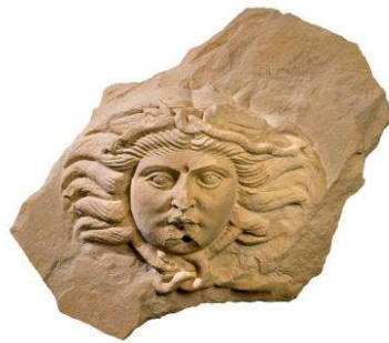
Brollador d'una font amb la imatge de Medusa Segles II-III Vil·la del Romeral (Albesa) Museu de Lleida

En aquest àmbit es parla, també, del territori que envoltava les ciutats: el saltus (bosc) i l' àger (camp). D'aquí s'obtenien algunes matèries primeres, es caçava, es conreava i es pasturava. I allà hi havia, també, algunes vil·les importants, que responien a la nostra idea de masos.