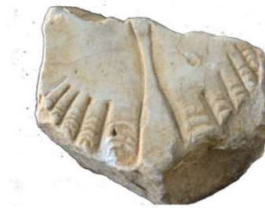
Fragment de marbre (marmor) de revestiment i decoració de les termes d'Ilerda Segle II Arxiu Arqueològic de Lleida

El següent àmbit parla de la domus i la vida quotidiana. En aquella època, el tipus de domus més estesa era la que es construïa al voltant d'un pati central porticat, o un peristil al qual s'accedia des de les diferents estances. De domus o cases n'hi havia de més grans i de més petites, com ara. Les domus imperials, que trobem a les nostres tres ciutats, no tenien res a envejar a les d'altres punts de l'Imperi: mil metres quadrats o més, grans patis centrals, acabats de luxe, habitacions calefactades, parets pintades al fresc i marbres de qualitat. Aquest àmbit parla, també, de com vestien els romans i romanes, de la seva estètica i cura personal, dels seus jocs i joguines i dels rituals domèstics.