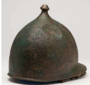
Casca celtiber 85-77 a.n.e. Piquete de la Atalaya (Azuara, Saragossa) Museo de Zaragoza

crear els primers campaments militars a la Península Ibèrica. L'àmbit mostra quin armament portaven els ibers i els romans i destaca les figures dels cabdills ilergets Indíbil i Mandoni, que no van poder impedir que els romans, amb tota la seva potència, s'acabessin imposant i es quedessin al territori, instal·lant una xarxa d'enclavaments militars des d'on ho controlaven tot.