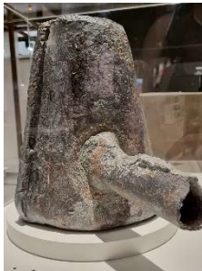
Registre i purgador de plom d'una canonada Segles I-II Parc Arqueològic de Iesso (Guissona) Museu de Guissona

Un altre tema important a les ciutats romanes era el de l'aigua, la vida i la higiene , que s'aborda en un altre dels àmbits temàtics. La de Roma va ser una vertadera cultura de l'aigua. Es van construir fonts, aqüeductes, canonades, pous, canalitzacions i termes. Quan es triava un lloc per construir-hi una ciutat, s'asseguraven que disposés d'aigua fresca abundant i constant. La recollien dels rius i les fonts, excavaven pous i, si calia, construïen aqüeductes. Una xarxa soterrada de canals i clavegueres la distribuïa per tota la ciutat i recollia l'aigua bruta. I va ser aquesta presència de l'aigua la que va permetre un elevat grau d'higiene corporal i d'oci, amb l'invent de les termes. L'àmbit destaca les d'Ilerda i les de Iesso.