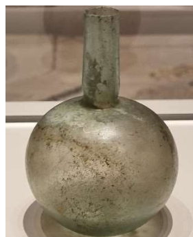
Ungüentari de vidre Segle IV Vil·la de Llorís (Isona) Museu de la Conca Dellà

El següent àmbit parla de la domus i la vida quotidiana. En aquella època, el tipus de domus més estesa era la que es construïa al voltant d'un pati central porticat, o un peristil al qual s'accedia des de les diferents estances. De domus o cases n'hi havia de més grans i de més petites, com ara. Les domus imperials, que trobem a les nostres tres ciutats, no tenien res a envejar a les d'altres punts de l'Imperi: mil metres quadrats o més, grans patis centrals, acabats de luxe, habitacions calefactades, parets pintades al fresc i marbres de qualitat. Aquest àmbit parla, també, de com vestien els romans i romanes, de la seva estètica i cura personal, dels seus jocs i joguines i dels rituals domèstics.