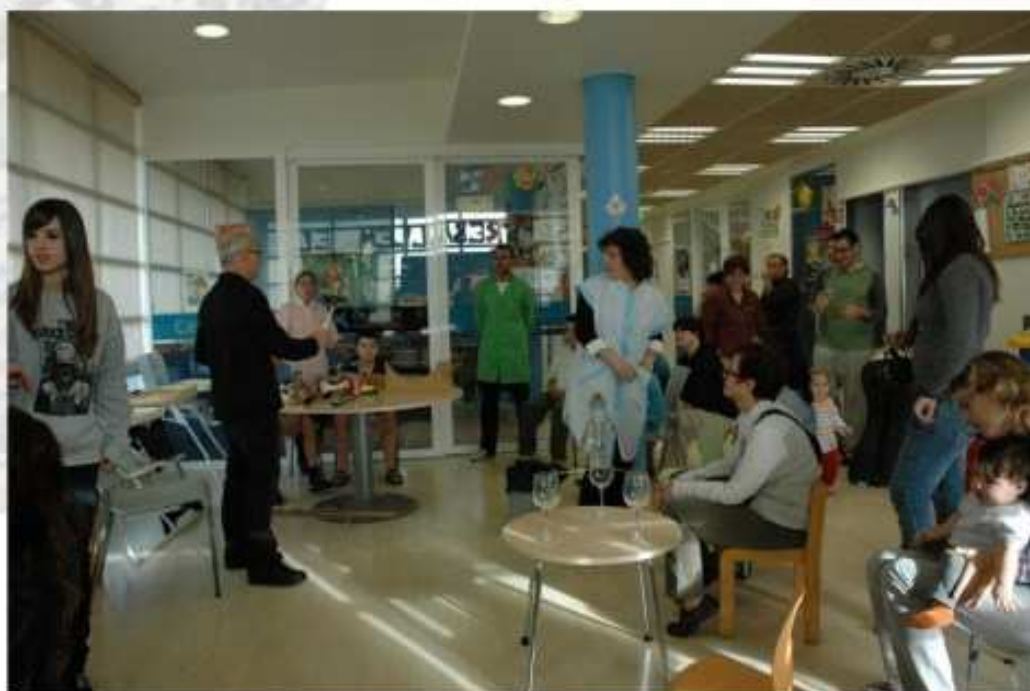
Aula hospitalaria del Hospital Universitario Arnau de Vilanova.

El Museo Hospitalario realiza talleres educativos adaptados a las necesidades educativas de las aulas hospitalarias y cuenta con la supervisión de los responsables de las mismas. Se trata de actividades que se realizan, según los casos, con la participación de los padres o de los profesionales del centro hospitalario.